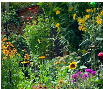
Wunderschöner bunter Herbstgarten, ein Paradies für Augen und Igel.